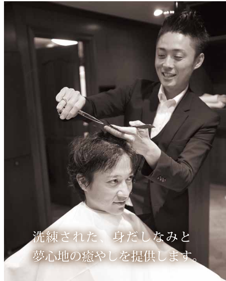
理容室 BARBER kaie 2017年5月施工